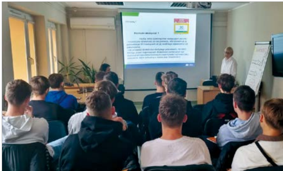
Spotkania ze specjalistami cieszyły się dużym zainteresowaniem młodzieży.

z tym wyglądają kwestie związane z opłacaniem składek ubezpieczeniowych. Doradcy zawodowi poinformowali z kolei uczestników spotkania o zasadach ubiegania się o fundusze na podjęcie działalności gospodarczej. Innego dnia młodzież z usteckiej placówki spotkała się w pośredniaku z ekspertami Urzędu Skarbowego. Hasłem przewodnim spotkania była „Firma