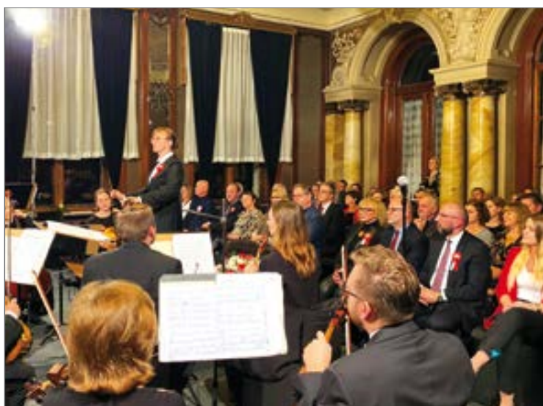
Koncert zorganizowano w najbardziej reprezentacyjnej sali pałacu w Damnicy.