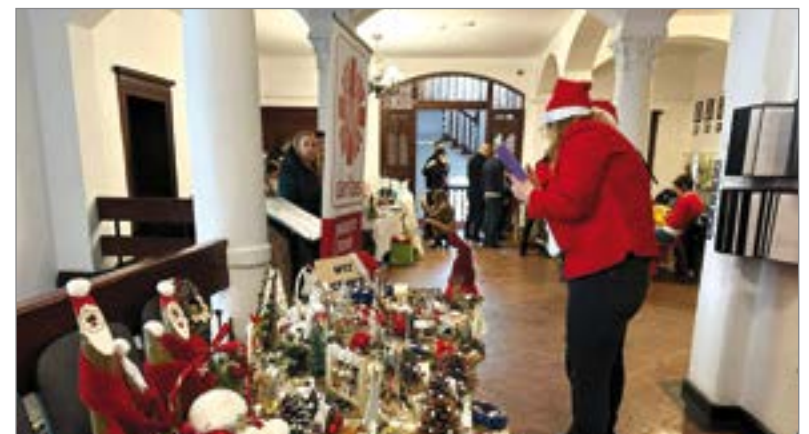
Ozdoby zaprezentowano na wystawie na piętrze starostwa.

Przytocka, a także Dziennego Domu Pomocy w Damnicy, uczestników Warsztatów Terapii Zajęciowej Caritas w Sycewicach i członków stowarzyszenia ABI.