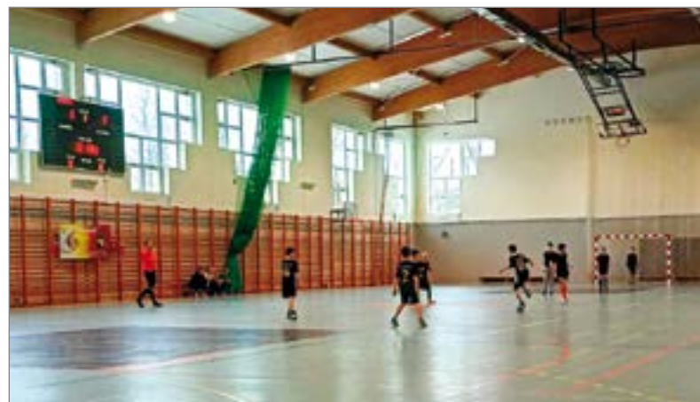
Zawody rozegrano w sali sportowej szkoły w Kobylnicy.