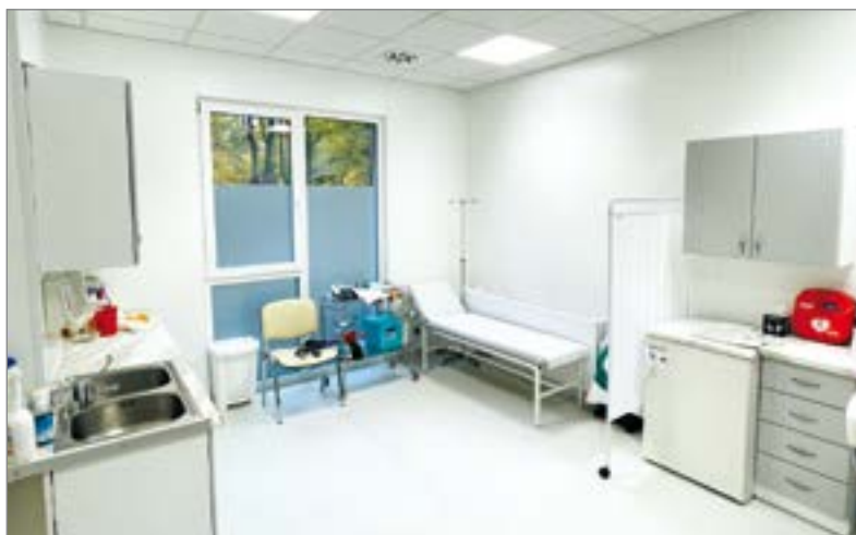
Nowa przychodnia gwarantuje pacjentom wysoką jakość usług medycznych.