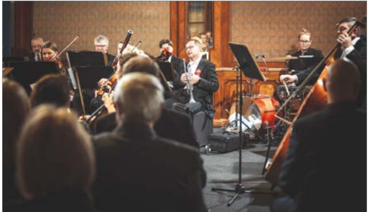
Muzycy słupskiej orkiestry zaprezentowali największe przeboje muzyki klasycznej.