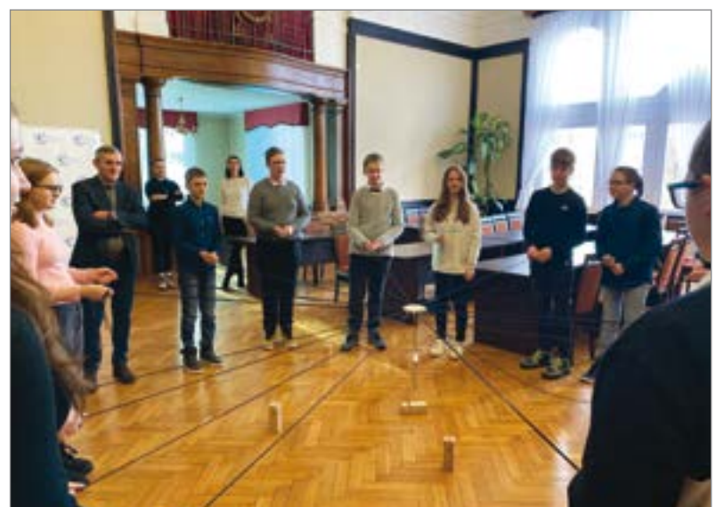
Uczniowie wzięli też udział w grach zespołowych.