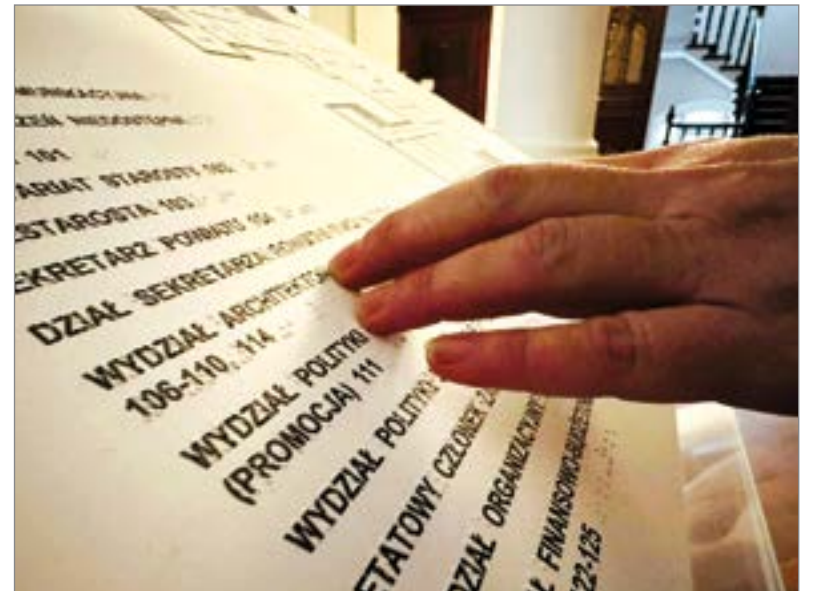
Dzięki inwestycji w budynku zamontowano specjalne tablice informacyjne dla osób niewidzących.

Warte prawie sto tysięcy złotych zadanie zostało w całości sfinansowane ze środków Programu Operacyjnego Wiedza, Edukacja w ramach projektu „Dostępny samorząd”, realizowanego przez Państwowy Fundusz Rehabilitacji Osób Niepełnosprawnych.