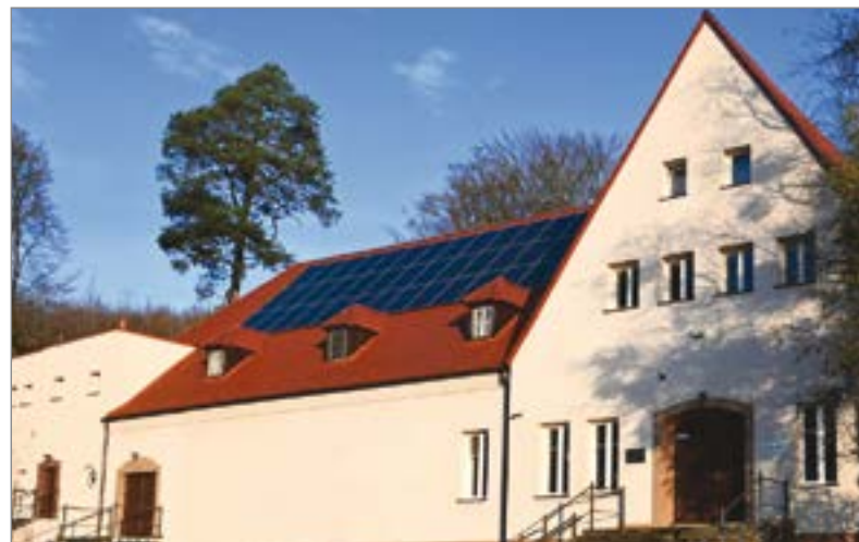
Instalację solarną zamontowano m.in. na budynku biblioteki.

Szesnaście obiektów użyteczności publicznej na terenie gminy Kępice będzie zasilanych odnawialnymi źródłami energii. Inwestycja otrzymała prawie 2,5 mln zł unijnego dofinansowania.