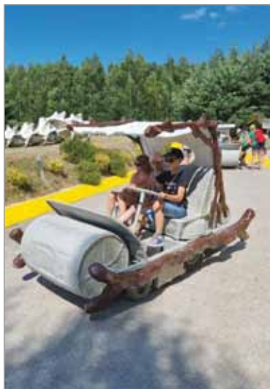
Jedną z atrakcji dla uczestników projektu był wyjazd do Parku Dinozaurów w Lebie.

Dzięki realizacji projektu szesnastu usamodzielniających się wychowanków pieczy zastępczej wzmocniło swoje kompetencje