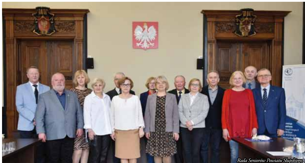
Rada Seniorów Powiatu Słupskiego.

Ponad trzystu seniorów z powiatu słupskiego udało się zaktywizować dzięki licznym szkoleniom, warsztatom, zachęceniu do działalności w utworzonych specjalnie dla nich Klubach Seniora oraz zapewnieniu im dostępu do usług sąsiedzkich, specjalistycznych i asystenckich.