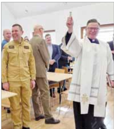
Uroczyste otwarcie zgromadziło wielu gości.

Ponad milion złotych kosztowała nowa świetlica wiejska w Głuszynie w gminie Potęgowo. Z nowoczesnego i energooszczędnego obiektu mieszkańcy mogą korzystać od marca. Parterowa świetlica ma 123 metry kwadratowe powierzchni. Znajdują się w niej sala główna, kuchnia, pomieszczenia gospodarcze i toalety. Budynek ogrzewany jest pompą ciepła, której efektywność wspomaga zainstalowany system rekuperacyjny, pozwalający na odzyskiwanie części ciepła oraz klimatyzacja. Budowa tego długo oczekiwanego przez mieszkańców obiektu trwała niespełna rok. Uroczystość otwarcia obiektu zorganizowano 3 marca. Wzię-