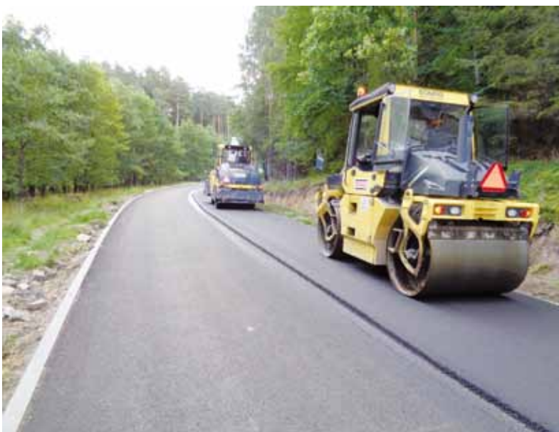
Liczba realizowanych inwestycji drogowych w powiecie sprawia, że wygląda on niczym wielki plac budowy. Na zdjęciu modernizacja drogi w Dębnicy Kaszubskiej.

Łącznie do remontu przewidziano ponad szesnaście kilometrów odcinków dróg, a każdy z nich ma duże znaczenie w systemie sieci drogowej powiatu słupskiego. Stanowią one m.in. połączenia w kierunku dróg krajowych i wojewódzkich oraz miejsc atrakcyjnych turystycznie. W gminie Słupsk przebudowany będzie odcinek z Wielichowa do Bruskowa Wielkiego, a w gminie Smołdzino od ul. Partyzantów w Gardnie Wielkiej. W gminie Damnica do remontu przewidziano odcinek od Damna do Wiatrowa, ale tylko poza tymi miejscowościami. Natomiast w gminie Kępcice nowy asfalt pojawi się na trasie Ciecholub - Darnowo. W gminie Główczyce prace będą prowadzone