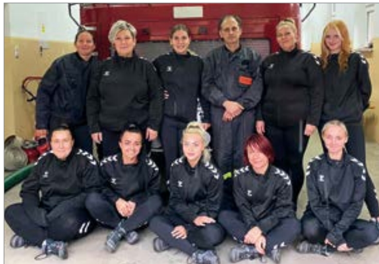
Kobieca drużyna OSP z Mielna.

W Kalwarii Zebrzydowskiej wzięło udział 39 najlepszych drużyn pożar-