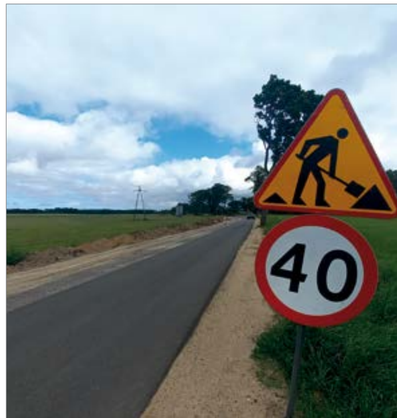
Prace prowadzone są niemal na całej długości inwestycji. Poszczególne odcinki są jednak na różnym poziomie zaawansowania prac.

Zakończenie wszystkich prac ma nastąpić jeszcze w tym roku.