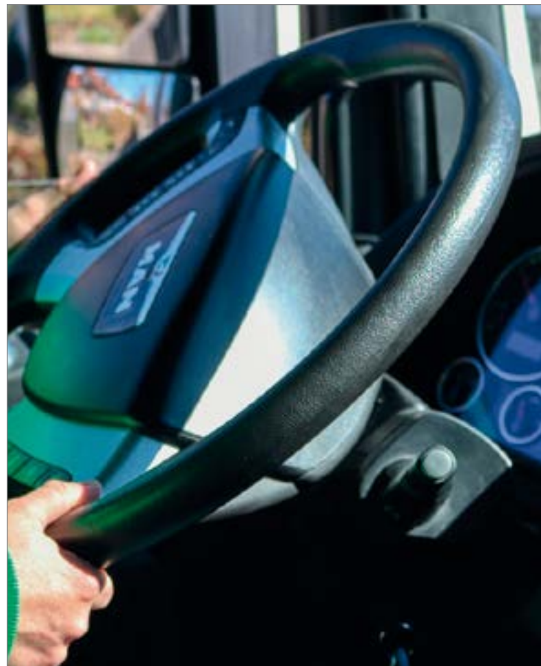
Kierowca samochodów ciężarowych to jeden z bardziej poszukiwanych zawodów na słupskim rynku pracy

Podejmując decyzję o dalszym kształceniu, warto uwzględnić jakie zawody na lokalnym rynku pracy dają zatrudnienie, a jakie go nie gwaran-