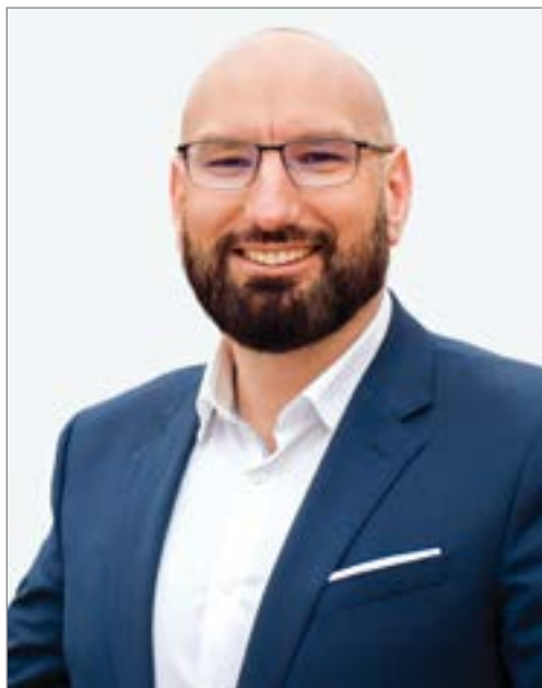
PAWEŁ LISOWSKI starosta słupski