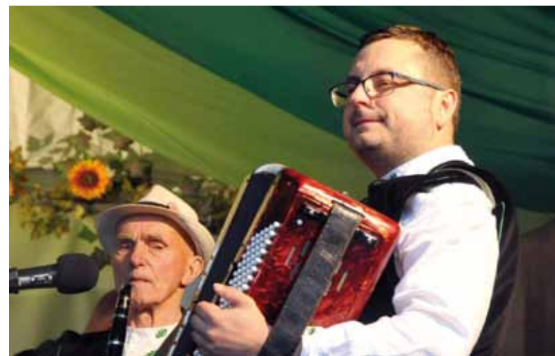
Na scenie prezentowały się lokalne zespoły ludowe.