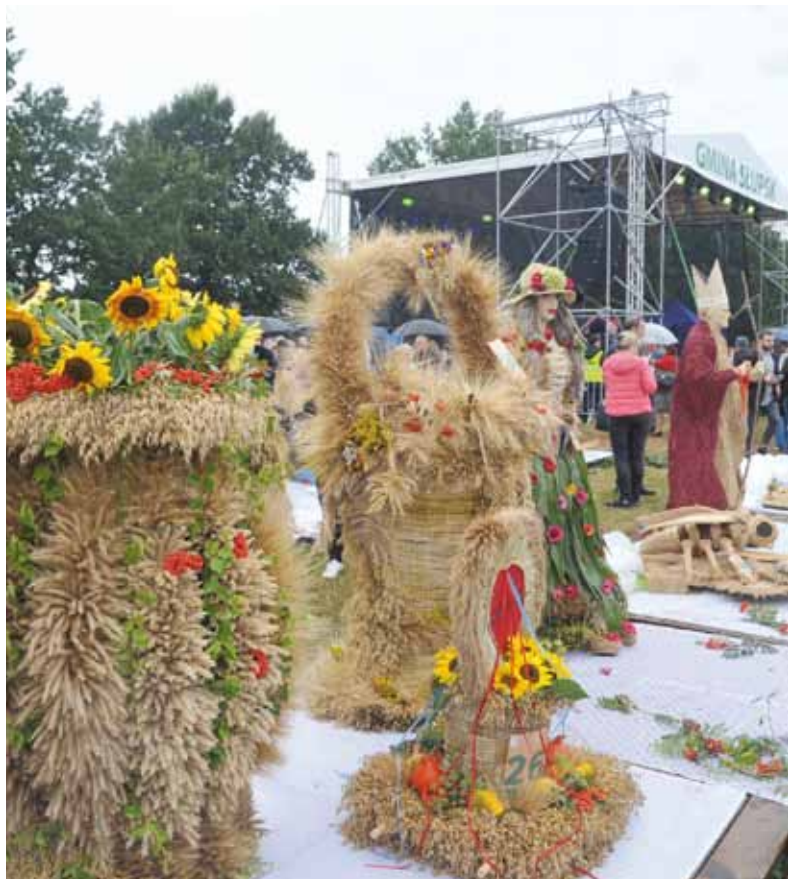
Do konkursu na najpiękniejszy wieniec zgłoszono w tym roku 54 kompozycje.