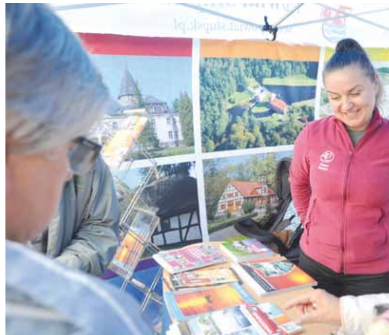
Swoje stoiska promocyjne podczas dożynek wystawiło Starostwo Powiatowe i niektóre samorządy.