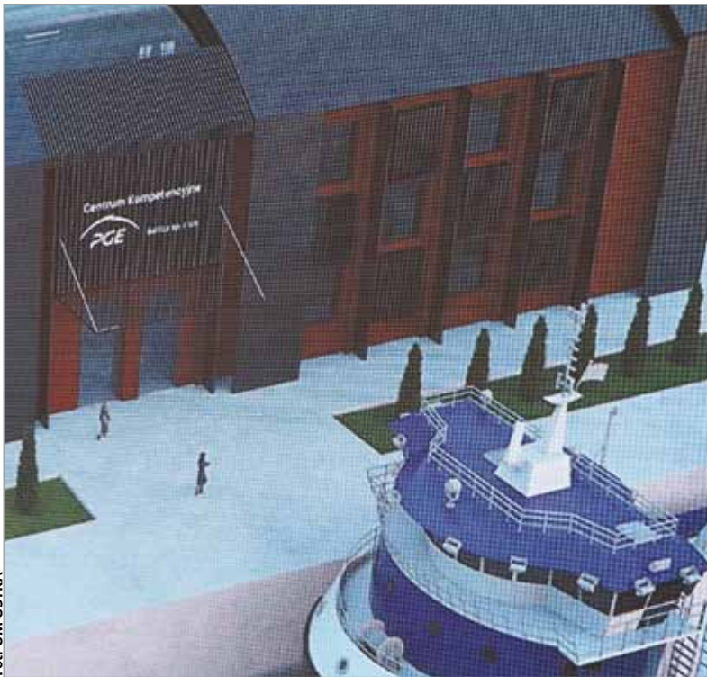
Tak ma wyglądać centrum edukacyjno-naukowe zlokalizowane w usteckim porcie.

Na terenie portu w Ustce powstanie także Centrum Kompetencji Morskiej Energetyki Wiatrowej. Przyszli specjaliści nabędą w nim uprawnienia i kompetencje do pracy przy utrzymaniu infrastruktury i rozwoju morskich elektrowni wiatrowych. W Centrum Kompetencji będą również testowane i wdrażane nowe innowacyjne technologie związane z morską energetyką wiatrową.