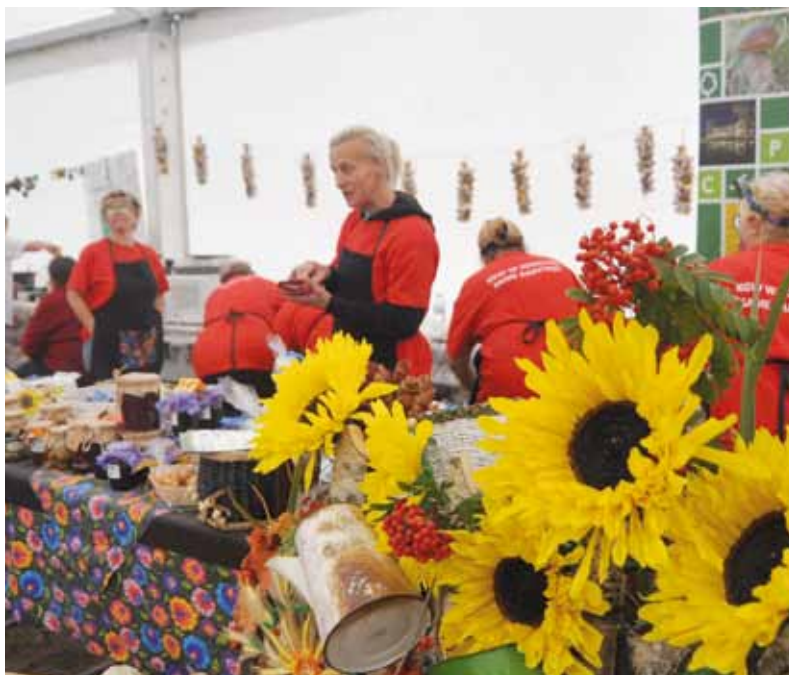
W hali namiotowej można było posilić się przysmakami przygotowanymi przez kółka gospodyń.