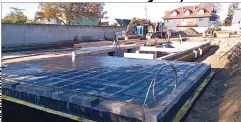
Na budowie mieszkań przy ul. Głównej wylewany jest obecnie strop nad piwnicą.

Przy ulicy Głównej w Kobylnicy powstaje budynek, w którym znajdzie się dwanaście mieszkań komunalnych. Na razie budowa jest na etapie stropu nad piwnicą. Na trzech piętrach znajdzie się dwanaście mieszkań o powierzchni około 50 m kw, w tym cztery specjalnie zaprojektowane z myślą o osobach z niepełnosprawnościami. Z kolei w Sycewicach trwają roboty budowlane związane z wykonaniem nowego odcinka sieci wodociągowej, która będzie doprowadzona do miejscowości Komorzyn, gdzie od nowego roku budowana będzie zbiorcza kanalizacja grawitacyjna oraz przepompownia ścieków. Do końca zbliża się też przebudowa ulicy Transportowej w Kobylnicy. Nowy asfalt położono już na