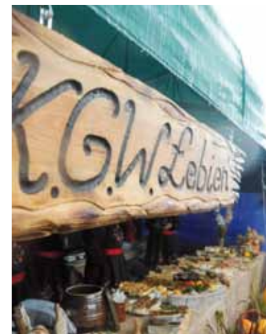
Mimo deszczowej pogody smakołyki przygotowane przez koła gospodyń cieszyły się dużym zainteresowaniem odwiedzających.