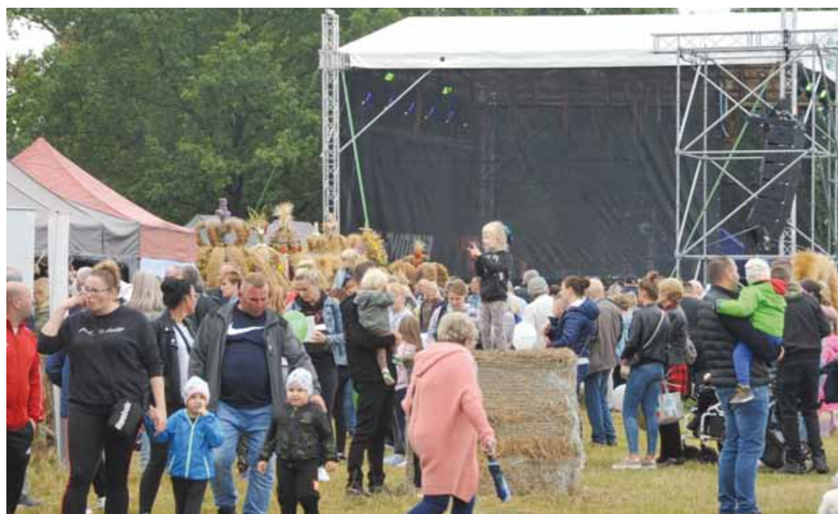
Impreza w Swołowie zgromadziła mieszkańców Słupska i powiatu słupskiego.