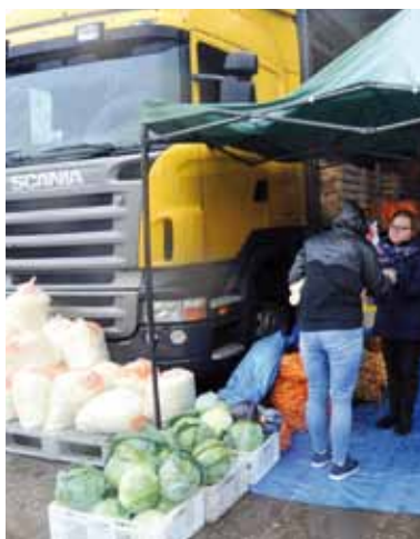
Podczas imprezy można było zaopatrzyć się w warzywa i kwiaty.