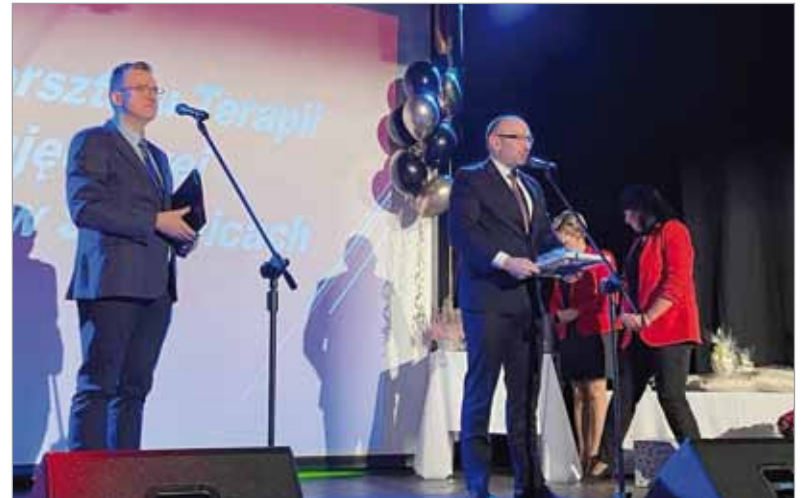
Podczas gali starosta słupski dziękował pracownikom warsztatu za zaangażowanie w pracę na rzecz mieszkańców powiatu.