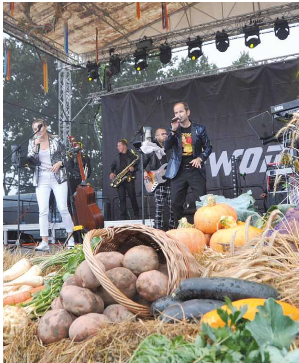
Muzyczną gwiazdą imprezy był Sławomir, który zaśpiewał wszystkie swoje największe przeboje.