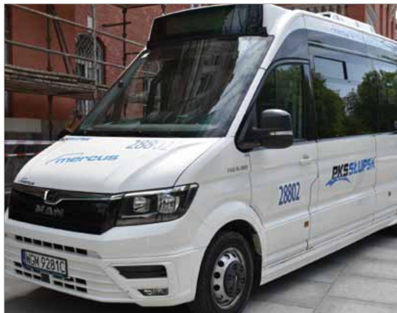
Mniejsze autobusy, które zasyliły tabor słupskiego PKS, pozwalają przewoźnikowi na większą elastyczność w budowie rozkładów jazdy.