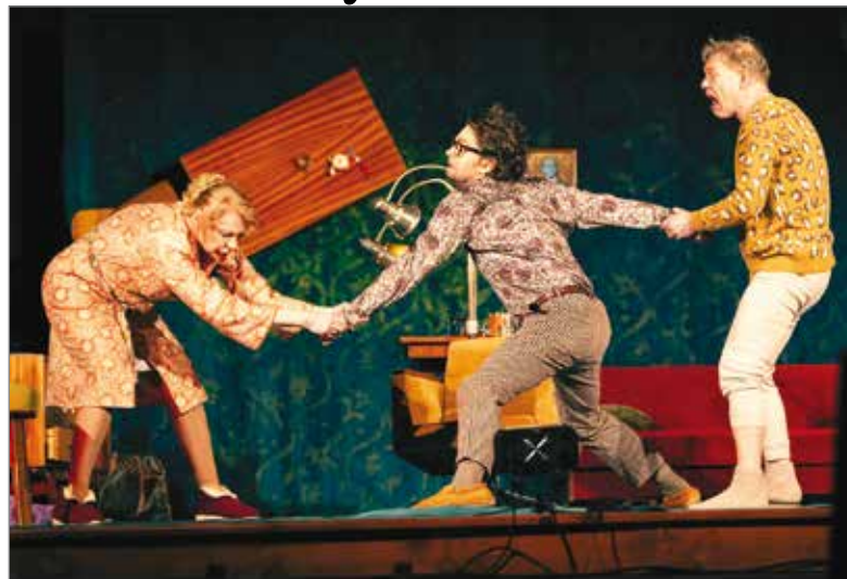
Spektakl „Wykrywacz kłamstw” w wykonaniu aktorów Nowego Teatru w Słupsku.